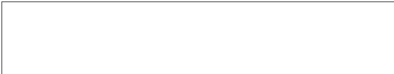
Diagrama de producción